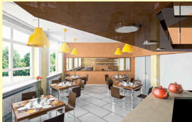
Być może tak będą wyglądać nowe pracownie w bieruńskim PZS-ie.