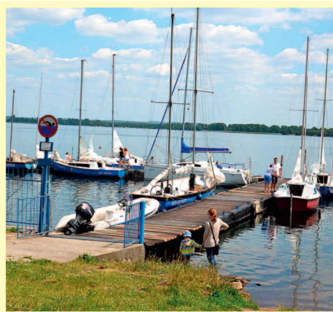
Przystań Yacht Clubu Opty.