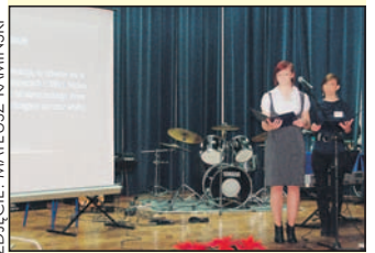
Prezentacja pomysłu na firmę przez uczestniczki projektu.

Szkół w Bieruniu uczyła się przedsiębiorczości w ramach projektu „Moja Firma w Mojej Gminie”, realizowanego we współpracy z Fundacją Viribus Unitis. Podczas Szkolnego Dnia Przedsiębiorczości uczniowie przedstawili swój pomysł na biznes w gminie Bieruń kolegom z klas pierwszych i drugich. Wymyślone przez nich Muzeum Górnictwa „Czarne Złoto” w założeniach jest nie tylko sposobem na zarabianie pieniędzy ale też promocję miasta. Urząd Miejski w Bieruniu objął honorowym patronatem tenże projekt. Kilka eksponatów muzeum można było zobaczyć na wystawie, którą pomogli przygotować instruktorzy praktycznej nauki zawodu.. ■ BS