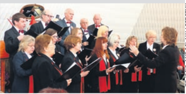
Śpiewa chór z Gliwic.