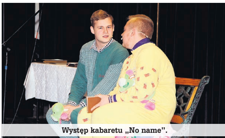
Występ kabaretu „No name”.

na rowery i motorowery, budowa pracowni dla zawodu technik urządzeń i systemów energetyki odnawialnej.