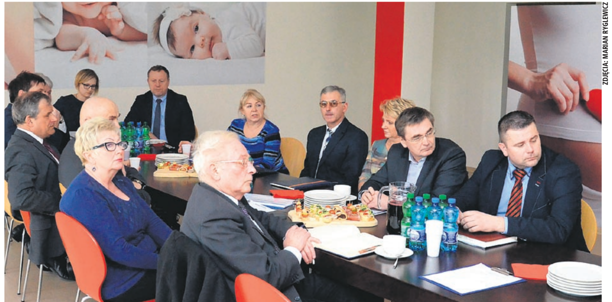
Spotkanie radnych i zarządu spółki odbyło się w przyszpitalnej szkole rodzenia „Od brzuszka do maluszka”.

- Szpital musi przyjąć i zaopatrzyć każdego pacjenta – mówił starosta. - Większość wchodzi w tzw. nadwykonania. Narodowy Fundusz Zdrowia płaci za nadwykonania 50 - 60%. Po raz pierwszy w ubiegłym roku zapłacono szpitalowi nadwykonania prawie w 100%, w związku z tym strata jaką szpital poniósł w 2015 roku wyniosła tylko 229 tys. zł netto.