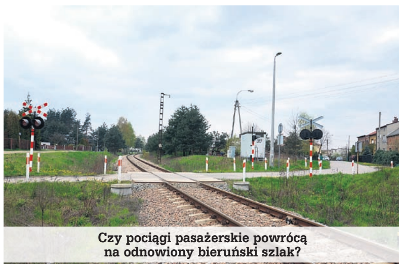
Czy pociągi pasażerskie powrócą na odnowiony bieruński szlak?

Krótszy czas przejazdu, integracja transportu kolejowego z systemem komunikacyjnym regionu, poprawa bezpieczeństwa ruchu kolejowego oraz zmniejszenie negatywnego oddziaływania transportu na środowisko to podstawowe cele poprawy