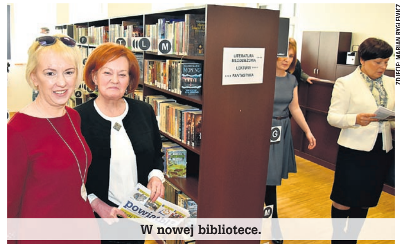
W nowej bibliotece.

► W pierwszym z nowo otwartych obiektów znajduje się sześć oddziałów przedszkolnych oraz jeden oddział żłobkowy. Łącznie z opieki może korzystać 150 przedszkolaków i 20 maluchów. Piękne i nowoczesne są nie tylko pomieszczenia i wyposażenie obu placówek. Przedszkolacy i żłobkowicze mają do dyspozycji plac zabaw wyposażony w atestowane urządzenia zabawowe. Budowa budynku gminnego przedszkola i żłobka oraz rozbiórka istniejącego budynku przedszkola w Bojszowach przy ul. Gaikowej była realizowana z budżetu gminy oraz ze środków Ministerstwa Pracy i Polityki Społecznej. Łączny koszt inwestycji wyniósł 7.691.638,73 zł (z czego 800.000 zł otrzymano z programu „Maluch” - edycja 2015). Inwestycja została zrealizowana w 16 miesięcy.