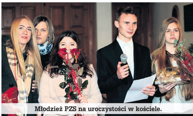
Młodzież PZS na uroczystości w kościele.

W planach jest zakup i montaż obrabiarki CNC w pracowni pneumatyki i hydrauliki, wykonanie parkingu