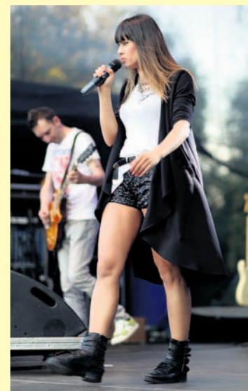
Występ gwiazdy sobotniego wieczoru - zespołu „Łzy” – zgromadził przede wszystkim młodzieżową publiczność. Ale dla każdego było coś miłego. Wystąpił też kabaret „KałaMaSz”, zespoły „Kwaśnica Bawarian Show”, „The Postman”, orkiestry dęte KWK Piast i Ziemowit.

i młodzież z imielińskich szkół oraz Zespół „The Postman”. Czynne były stoiska zabawowe dla dzieci, zaplecze gastronomiczne. Na stoiskach nie brakowało gadżetów. Wystawcy i organizatorzy (Wydział Promocji Starostwa