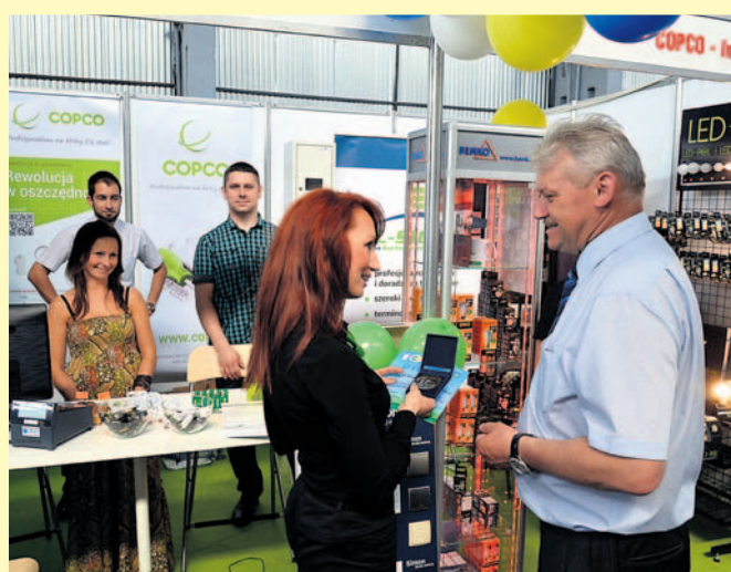
Wszyscy wystawcy otrzymali pamiątkowe medale i dyplomy uczestnictwa w targach. Dziękujemy za obecność i niemały wysiłek w przygotowaniu stoisk. Zapraszamy na kolejną edycję targów.