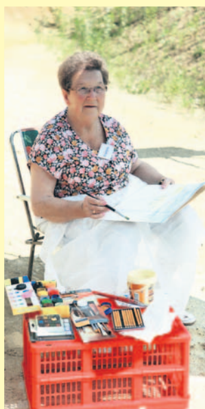
Twórcy przy pracy.