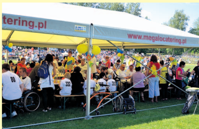
Po wysiłku – chwila wytchnienia pod namiotem połączona z konsumpcją kielbasek, ciast, napojów.