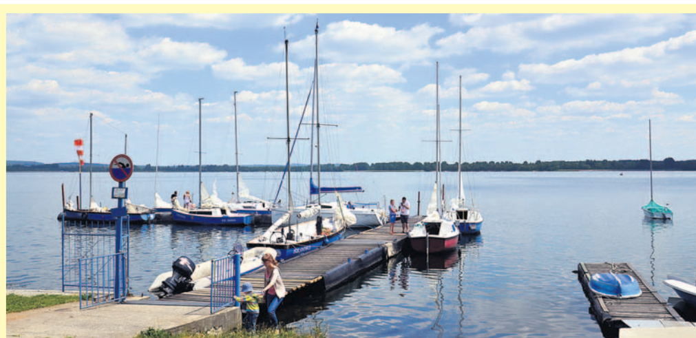
Przystań Yacht Clubu OPTY w Chełmie Śląskim. Woda i żagle plus przenieście i program biwaku - to magnes przyciągający jego uczestników.

Zewnętrzny symbolem podkreślającym tę ważną datę