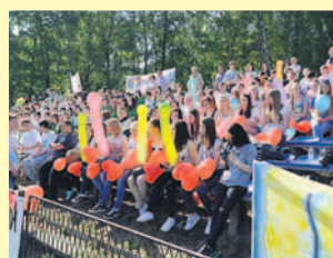
Doping kibiców był żywiołowy i wspaniały.