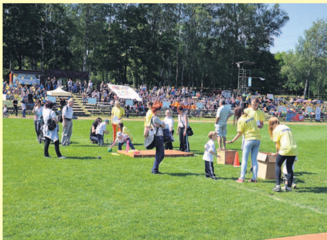
Zawodników, szczególnie najmłodszych, wspierali rodzice i opiekunowie.