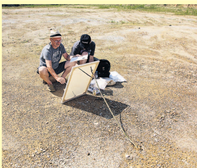
W imielińskich kamieniołomach.