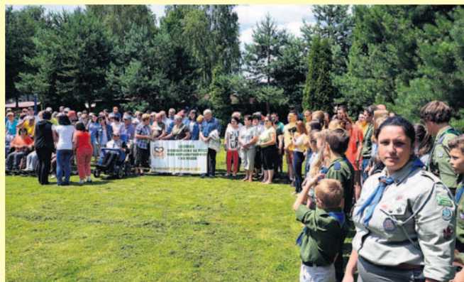
Zbiórka na uroczystą inaugurację.