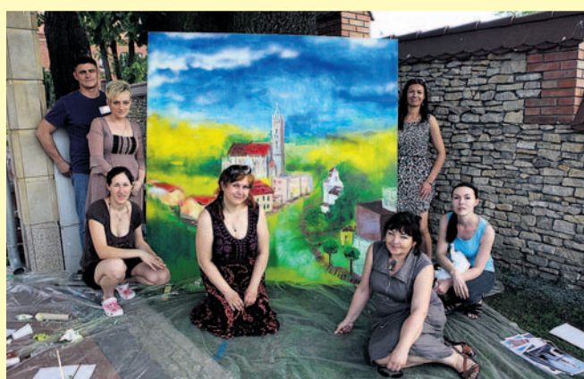
Jak artyści widzą Imielin, tak pokazali na obrazie - dzieło zbiorowym.