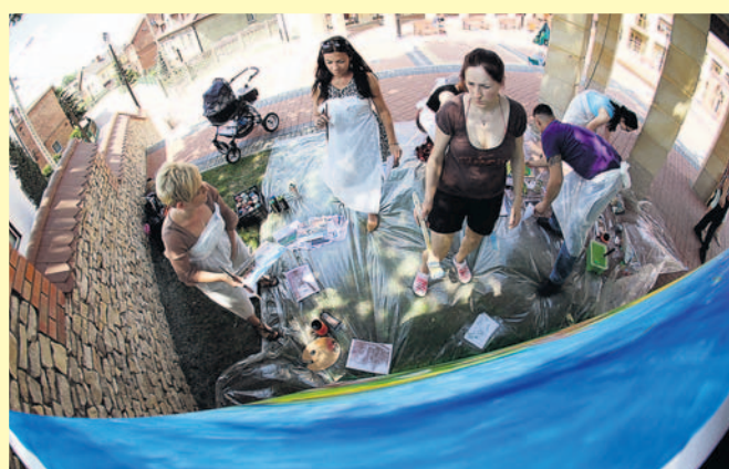
Na łądzińskim Placu Farskim.