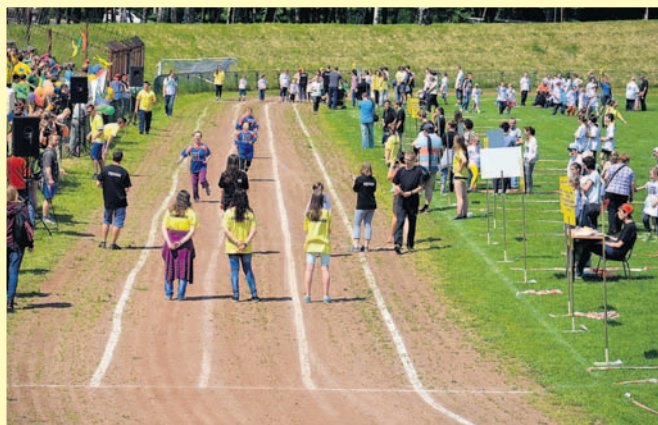
Bieg sztafetowy – koronna konkurencja igrzysk.