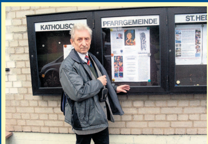
Przed gablotą informującą parafian o wystawie bieruńskiego artysty.