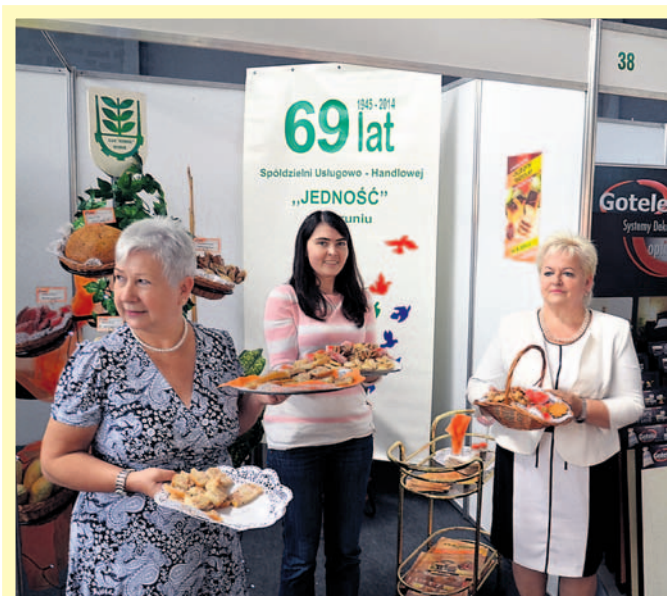
Od początku towarzyszy targom SUH Jedność z Bierunia.

edycji targowej. Tradycyjnie odbył się również konkurs ekologiczny, w tym roku zorganizowany pod hasłem „Oddaj bezpiecznie leki niebezpieczne”. Każdy, kto przy-