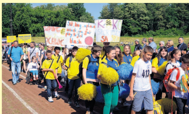
Przemarsz kolumny uczestników.

Najstarszą, cyklicznie organizowaną imprezą powiatową są Igrzyska Osób Niepełnosprawnych. Tradycja igrzysk jest zaledwie o parę miesięcy krótsza niż istnienie powiatu.