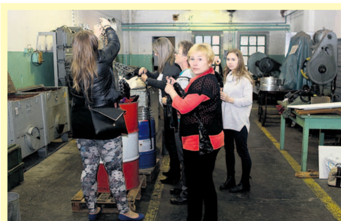
Zaczęło się w starej łuszkowni bieruńskiego ERG-u.