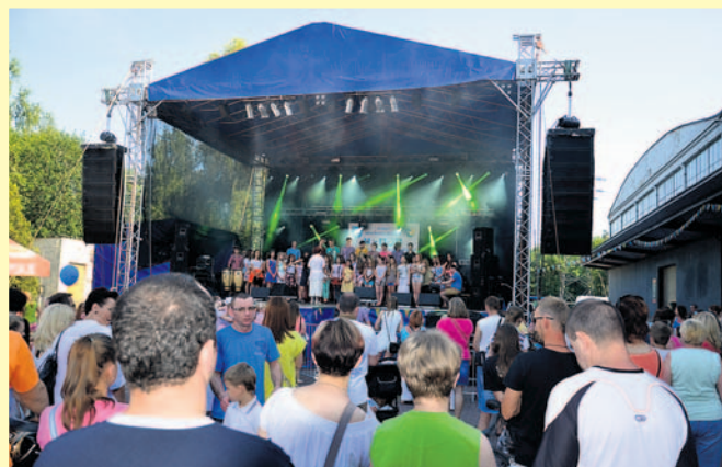
Dużym powodzeniem cieszyły się występy dziecięcych i młodzieżowych zespołów z Imielina.