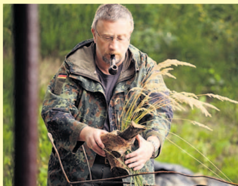
W poszukiwaniu tworzywa.