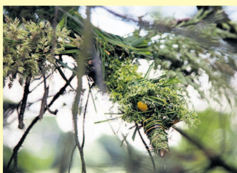
Przykład sztuki land-artu.