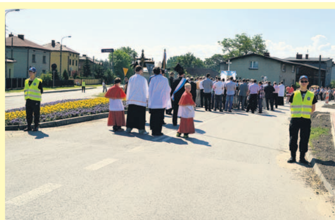
Młodzież na służbie czuwała nad bezpieczeństwem ruchu.

sjonalnie wytłumaczył gdzie i w jaki sposób ma instruować zmotoryzowanych użytkowników dróg. Młodzież zabezpieczała trasę podczas całej procesji. Miała okazję zobaczyć, w jaki sposób policjanci przygotowują się do tej pracy, w jaki sposób prowadzą akcję. Dla uczniów – przyszłych policjantów takie praktyki są niezwykle cennym doświadczeniem. Pokazują, na czym może polegać praca, którą chcą wykonywać w przyszłości i jak ważny jest jej społeczny wymiar. ■