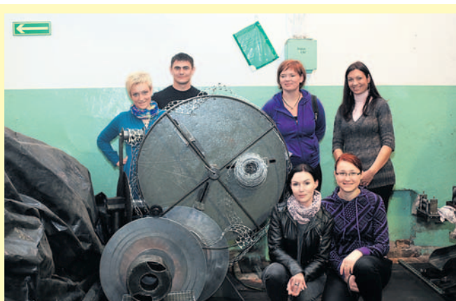
Maszyny okazały się ciekawym motywem do fotografii i obrazów.

Zakończył się kolejny, piąty już plener malarzki „Między Wieżami”, tym razem zorganizowany pod tytułem „Krajobraz przemysłowy – krajobraz sielankowy”. Plener odbył się w czterech różnych miejscach na terenie naszego powiatu.