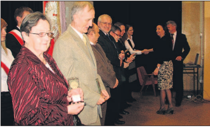
Najlepsi, najstarsi absolwenci.