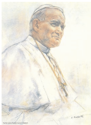
Galeria Starostwa Powiatowego w Bieruniu