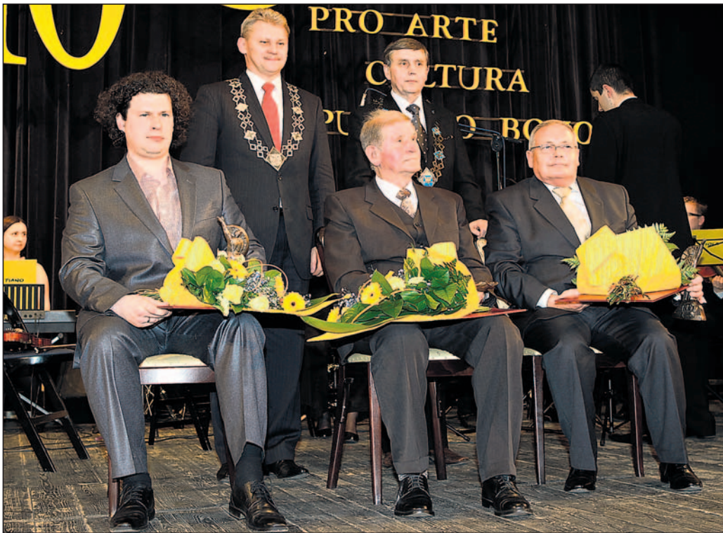
Wspólne, pamiątkowe zdjęcie laureatów i gospodarzy.

Dotychczas do nagrody kandydowało wiele osób i zespołów, lecz Clemensa otrzymali tylko nieliczni.