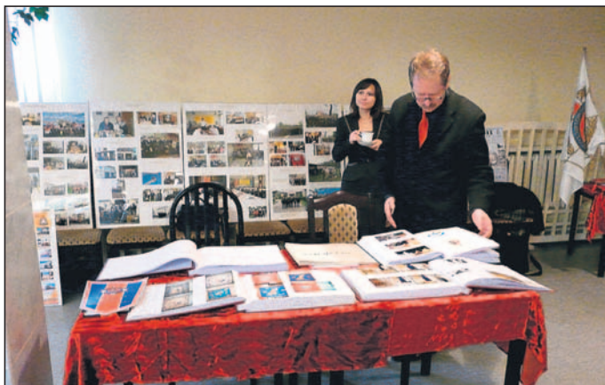
Wystawa strażackich kronik i dokumentów.

■ – Mamy obecnie dobre źródła finansowania, które pozwalają na zaspokojenie wielu potrzeb. Znaczna poprawa wyposażenia ochotniczych straży pożarnych naszego województwa wpłynęła na efektywniejszą działalność tych jednostek. Pomagają w tym dokonane zgodnie z postulatami strażaków – ochotników korzystne i długo oczekiwane zmiany niektórych przepisów, stwarzające bezspornie lepsze warunki funkcjonowania – mówił w Bieruniu senator – gen. brygadier w st. sp. Zbigniew Meres, prezes Zarządu Oddziału Wojewódzkiego Związku Ochotniczych Straży Pożarnych RP woj. śląskiego.