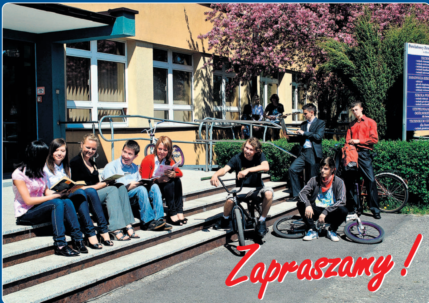
Młodzież Powiatowego Zespołu Szkół w Bieruniu.

DODATEK SPECJALNY DLA ABSOLWENTÓW GIMNAZJÓW