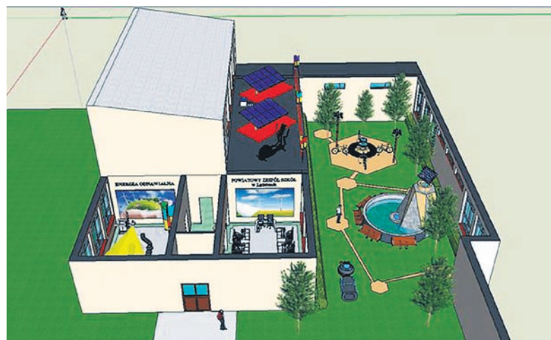
Projekt pracowni energetyki odnawialnej w PZS w Łędzinach oraz Powiatowej Biblioteki Publicznej w Bieruniu.