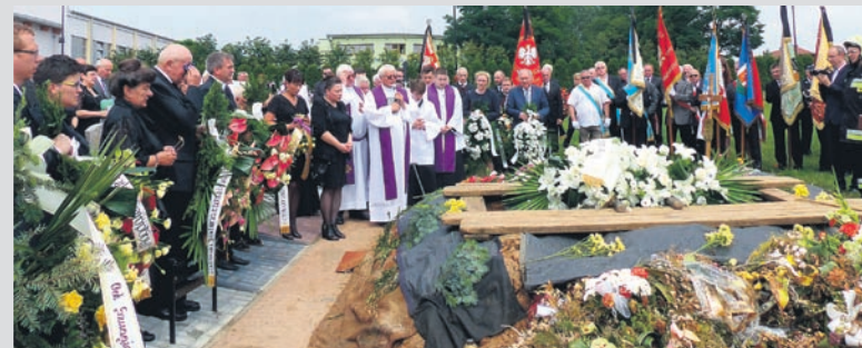
Wspólna modlitwa za Zmarłego.

W Cechu Rzemiosł i Przedsiębiorczości w Tychach działał aktywnie od 1982 roku. Nieprzerwanie od 1985 roku pełnił funkcję przewodniczącego Sekcji Spożywczej. Był członkiem zarządu cechu (1997-2004), potem członkiem komisji rewizyjnej. Mocno zaangażował się również w działalność na rzecz katowickiej Izby Rzemieślniczej, w której przez wiele lat był członkiem Komisji Egzaminacyjnej.