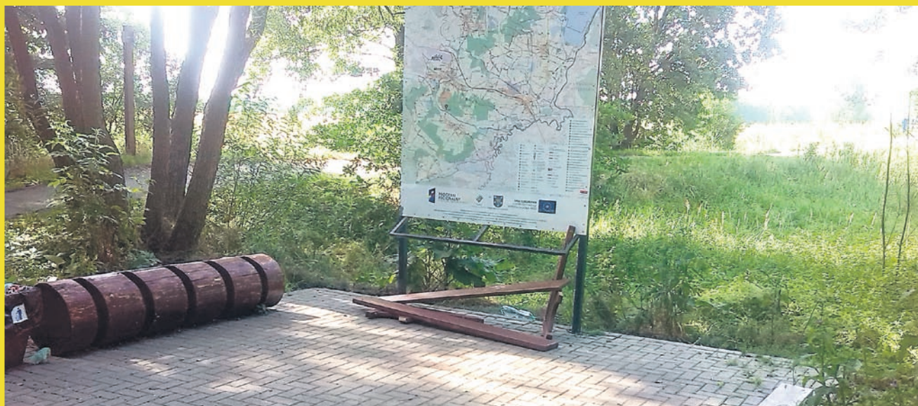
Zniszczona ławka przy ERG-u w Bieruniu.