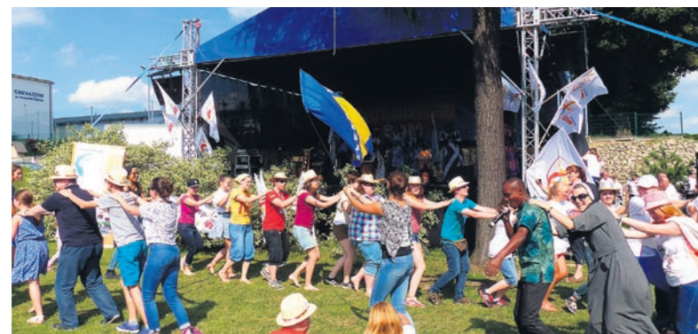
Wspólny taniec z zespołem „Claret Gospel” w Imielinie.

kanie w piątkowe popołudnie, 22 lipca, na terenie Ogrodów Farskich w Imielinie z udziałem pielgrzymów i mieszkańców powiatu. Po wspólnej modlitwie w kilku językach oklaskiwano gorąco koncert grupy ewangelizacyjnej „Claret Gospel” z Wybrzeża Kości Słoniowej oraz występ Imielińskiej Orkiestry Dętej. Grupa parafian z Chełmu Śląskiego zorganizowała dla wszystkich „Taniec uwielbienia”, by w trakcie wspólnych modlitw, śpiewów, tańców i zabaw wielbić