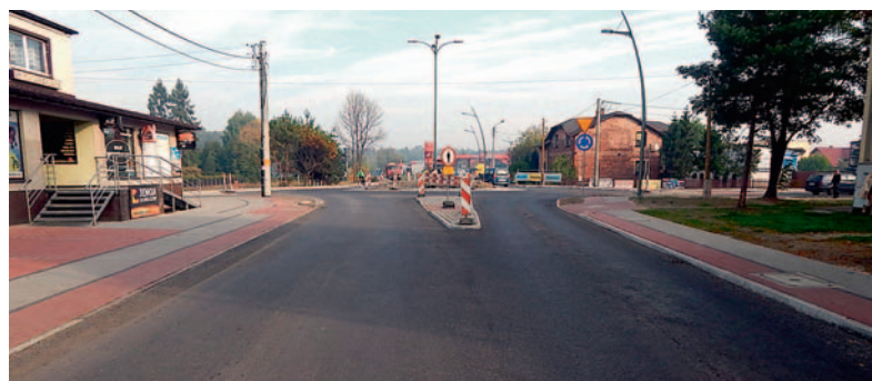
W trakcie przebudowy.

2. Przebudowa drogi powiatowej 5909S, ul. Hołdunowskiej w Lędzinach z zastosowaniem „cichych asfaltów” w km od 0+410 do 0+715 oraz w km od 0+803 do 1+835, na które powiat otrzymał promesę związaną z usuwaniem skutków klęsk żywiołowych.