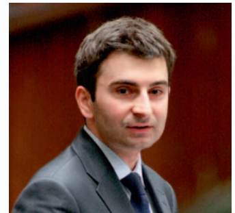
MAREK WÓJCIK – poseł na Sejm, przewodniczący Komisji Spraw Wewnętrznych, jeden z największych orędowników budowy tak potrzebnej nam trasy.

Zieloną, przerywaną kreską oznaczono ślad przebiegu drogi ekspresowej S-1.