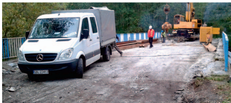
W trakcie przebudowy.

6. Przebudowa drogi powiatowej 5914S, ul. Murckowskiej w Lędzianach z zastosowaniem „cichych asfaltów” – etap II