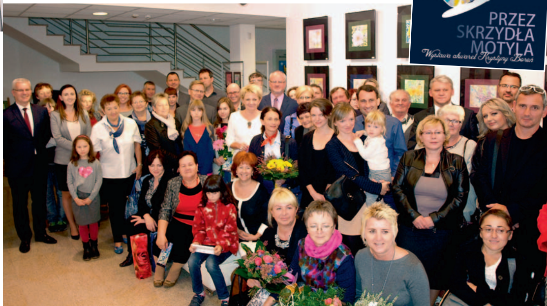
Zdjęcie pamiątkowe uczestników wernisażu.