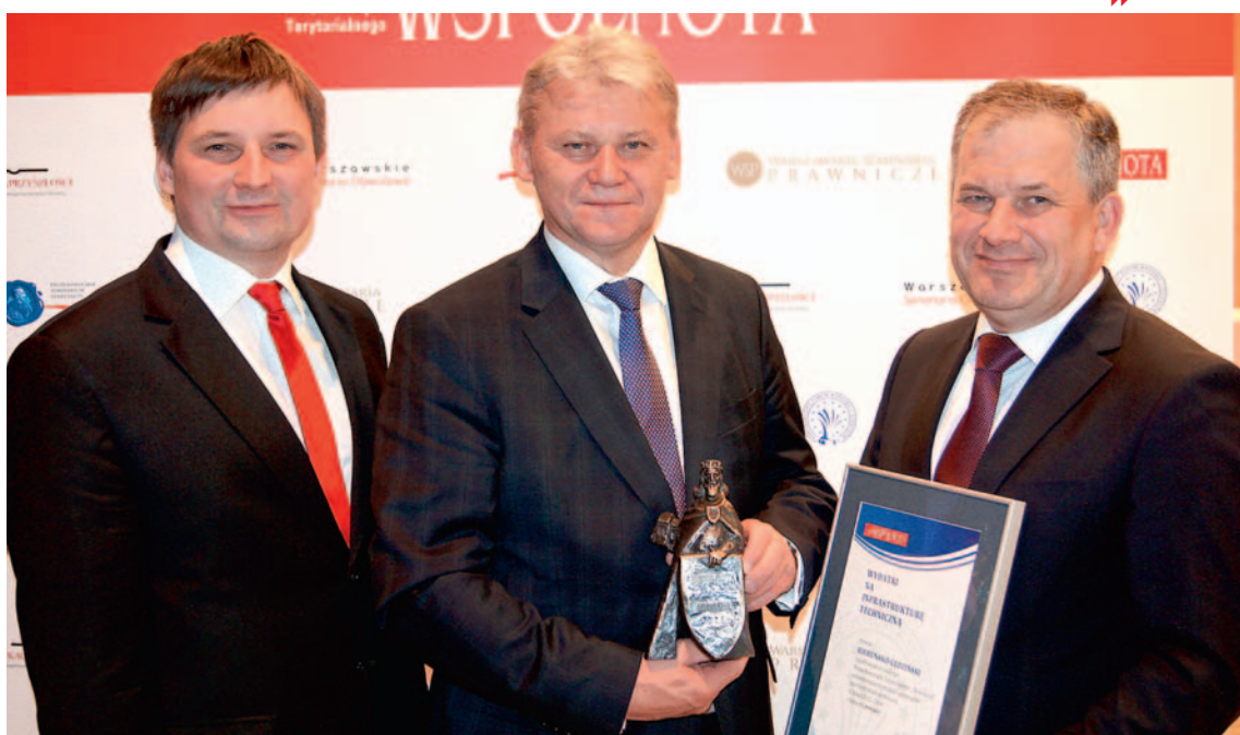
Twórcy inwestycyjnych sukcesów. Zarząd Powiatu funkcjonujący w niezmienionym składzie od 2010 roku.

dnocześnie do najbardziej dynamicznie rozwijających się powiatów w Polsce – przypomnieli. – Przez 15 lat jego istnienia systematycznie rosły dochody i wydatki budżetu oraz mierzone różnymi wskaźnikami dochody na mieszkańca. Każda kadencja władz powiatu stawała się coraz bardziej proinwestycyjna. Zrealizowaliśmy i nadal realizujemy szeroki program modernizacji i budowy dróg, mostów, cały zakres zadań związanych z edukacją, sportem, kulturą i wypoczynkiem, opieką i pomocą rodzinom i osobom niepełnosprawnym, z poprawą warunków życia i bezpieczeństwa rosnącej z roku na rok liczby mieszkańców powiatu. Wiele pozytywnego dzieje się