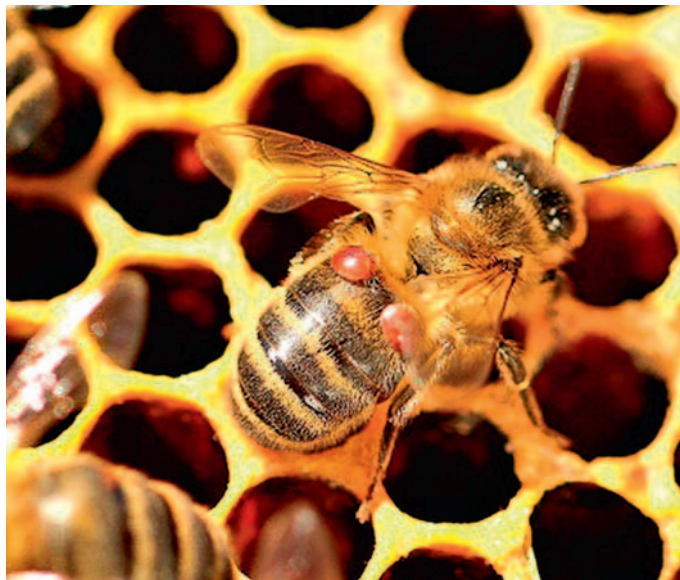
Pszczoła z warrozą.

Pszczoły miodne i dzikie owady zapylające odgrywają kluczową rolę w rolnictwie i produkcji żywności. Niestety, obecnie sto-