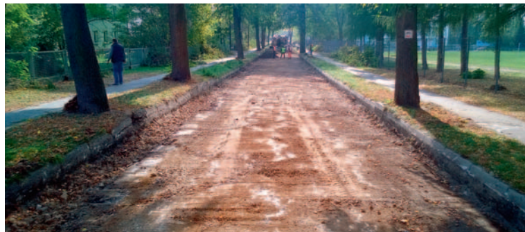
W trakcie przebudowy.

4. Remont mostu drogowego w ciągu drogi powiatowej 4138S, ul. Kopalnianej w Bojszowach w km 1+318 , na które Powiat otrzymał promesę na usuwanie skutków klęsk żywiołowych.