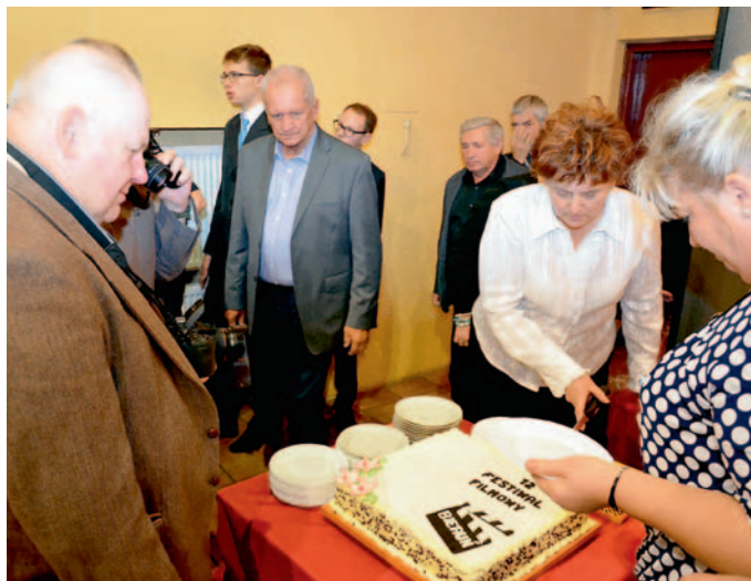
Festiwalowy tort smakował każdemu.

Organizatorzy i jurorzy z zadowoleniem podkreślają, że olbrzymim walorem tej imprezy jest wielopokoleniowość twórców filmowych. W Bieruniu spotykają się starsi wiekiem twórcy, którzy swoje dzieło utrwalali na ośmiomilimetrowych taśmach filmowych, używali „zdobycznego” sprzętu i wyposażenia, niechętnie przystosowując się do realizacji wideo, oraz filmowcy, którzy takiej taśmy w rękach nigdy nie mieli, a pierwsze filmiki robili przy użyciu telefonu komórkowego lub rozbudowanego o nowe filmowe funkcje cyfrowego aparatu fotograficznego, a swoje dzieła swobodnie mogą upowszechnić we wszechpanującym serwisie Youtube bądź jemu podobnych serwisach i portalach społecznościowych, tworzyć własne wideoblogi itp. Film jako sposób rejestracji rzeczywistości ogromnie się upowszechnił. Jako dzieło wykreowane i forma twórcza nadal pozostaje na swój sposób elitarny. Wzrasta poziom artystyczny i techniczny, maleje (a w niektórych przypadkach wręcz zaciera się) różnica między profesjonalami a amatorami. Coraz częściej i wyraźniej tą granicą staje się komercja i parcie na kasę: amatorzy (no, na pewno nie wszyscy) chcą, zawodowcy muszą na swej pracy zarobić. Dla pierwszych (z których część traktuje to jako etap do zawodowstwa) jest to odskocznia od codziennych zajęć, dla drugich już chleb codzienny. Kino amatorskie to kino domowej roboty, za kinem profesjonalnym stoją olbrzymie pieniądze, całe wytwórnie, producenci, ak-