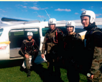
ZDJEŃCIE: PZS LĘDZINY

O wielu działaniach naszych szkół powiatowych informujemy, lecz o tak niezwykłym pi-