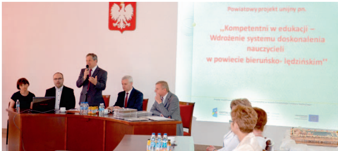
Zdobyta wiedza zostanie wykorzystana dla dobra uczniów i rodzin.