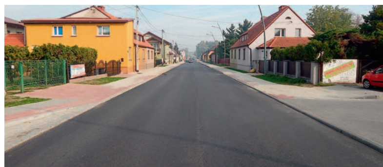
W trakcie przebudowy.

3. Przebudowa drogi powiatowej 5906S, ul. Chemików w Bieruniu w zakresie remontu w km od 1+430 do 2+720, które realizowane jest w ramach Narodowego Programu Przebudowy Dróg Lokalnych – Etap II Bezpieczeństwo – Dostępność – Rozwój.