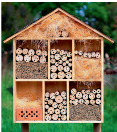
Hotelik dla owadów zapylających. Może być ustawiony w pobliżu pól, lasów, zagajników.

Opracowano na podstawie literatury fachowej, materiałów z Internetu i organizacji Greenpeace.