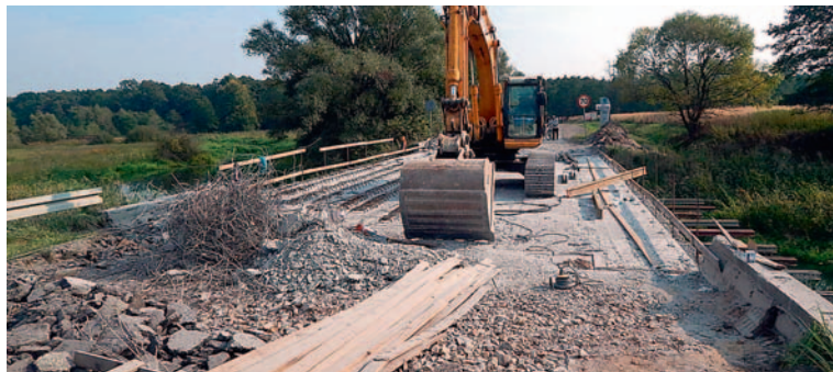
W trakcie przebudowy.

5. Remont mostu drogowego w ciągu drogi powiatowej 4136S, ul. Gilowickiej w Bojszowach w km 0+351 , na które Powiat otrzymał promesę na usuwanie skutków klęsk żywiołowych.