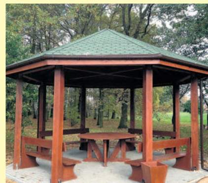
Jedna z wiat.

W kolejnych etapach planuje się budowę dróg rowerowych w koronie lewego wału wiślanego od ujścia Przemszy do mostu w Bieru-