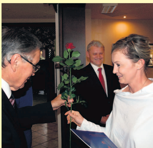
Były nagrody, kwiaty, uśmiechy...

Nagrody nauczycielom podległych sobie szkół i placówek wręczyli ich dyrektorzy. W gronie wyróżnionych pedagogów byli: