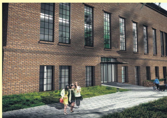
Obecny i przyszły wygląd obiektu.

loną powierzchnią pod sad, ogród warzywny i kwiatowy, uprawiane i pielęgnowane przez mieszkańców jako forma aktywizacji osób starszych. ■