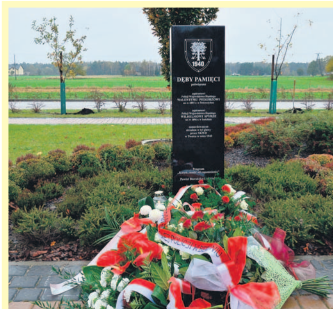
Pamiątkowa tablica poświęcona zamordowanym w 1940 roku funkcjonariuszom Policji Województwa Śląskiego.