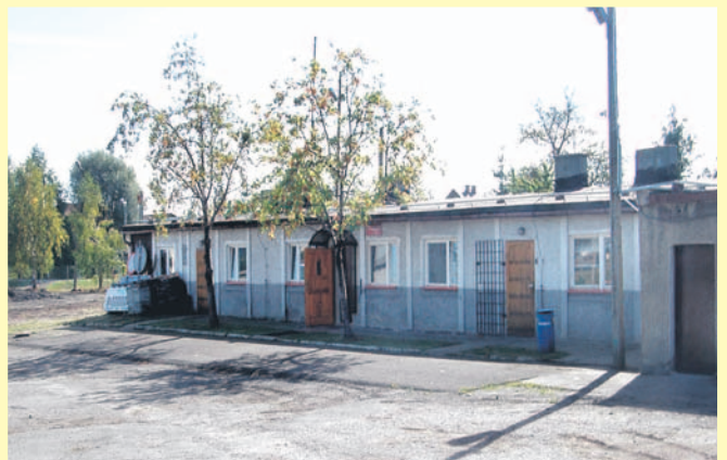
Dawna siedziba PZD.