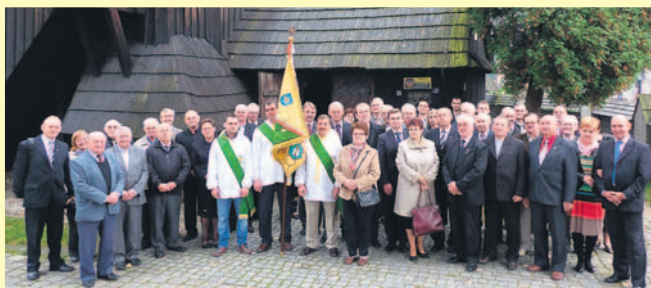
Pamiątkowa fotografia przed kościółkiem św. Walentego.