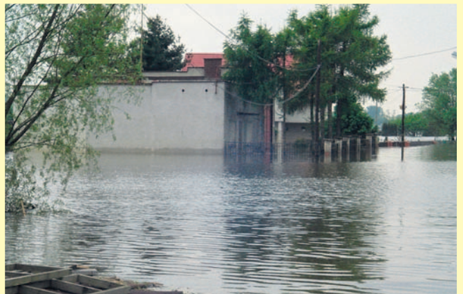
Zalane magazyny przeciwpowodziowe (maj 2010 roku).