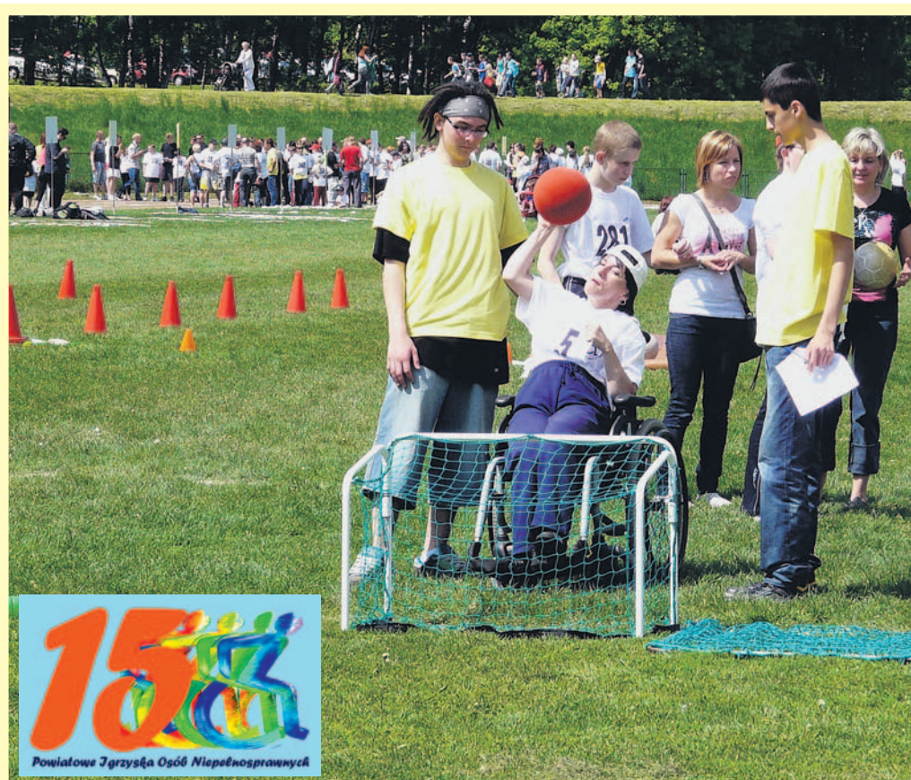
PCPR wspiera i propaguje działania mające na celu integrację, czego doskonałym przykładem są coroczne Powiatowe Igrzyska Osób Niepełnosprawnych. W tym roku odbędą się po raz piętnasty, 28 maja, na stadionie MKS w Łędzinach.

Aktywna, a zarazem bezpośrednia praca pracowników PCPR w środowisku przez lata działalności przyczyniła się do powstania stowarzyszeń osób niepełnosprawnych prężnie funkcjonujących na terenie powiatu bieruńsko-łędzińskiego oraz do propagowania i promowania rodzicielstwa zastępczego, a także do