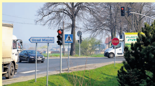
Skrzyżowanie DK-44 z ulicami Turystyczną i Pszenną – bez świateł to gehenna dla kierowców i pieszych.

Biorąc to pod uwagę komisja zwróciła się z apelem do Dyrektora Oddziału w Katowicach General-