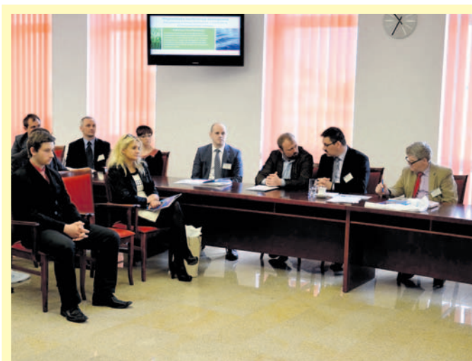
Konferencja odbyła się w sali sesyjnej starostwa.

Konferencja odbyła się 2 kwietnia w Starostwie Powiatowym w Bieruniu. Adresowana była do zaangażowanych w działalność proekologiczną przedstawicieli sektora publicznego, organizacji działających na rzecz środowiska naturalnego oraz przedstawicieli szkół zaangażowanych w rozwój świadomości ekologicznej młodzieży szkolnej. Ideą przewodnią konferencji było pozyskanie infor-