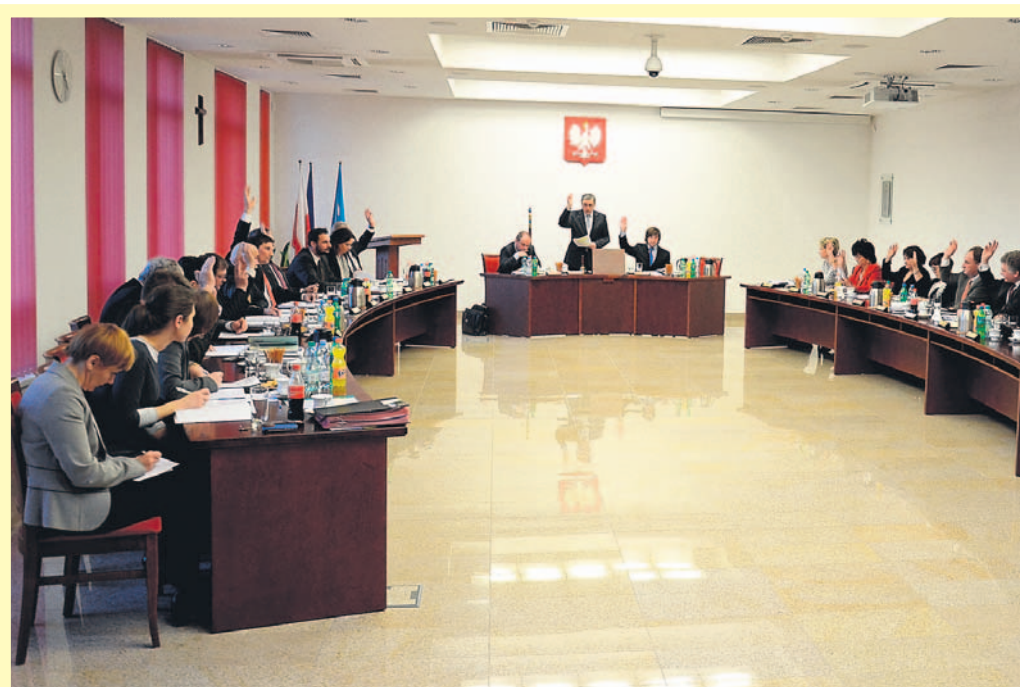
Radni jednogłośnie uchwaliли przyjęcie strategii.

Strategia jest dosyć obszernym dokumentem (w całości dostępnym na powiatowej stronie internetowej www.powiatbl.pl ). Nie jest to jednak konkretny plan pracy, a raczej wykaz pożądanych kierunków i efektów działania. ■MR