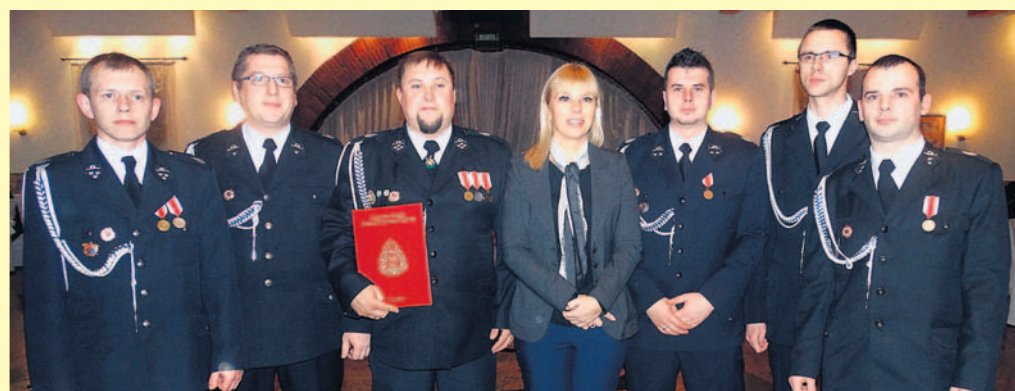
Grupa chełmskich strażaków z wicepremier Elżbietą Bieńkowską.

Po I Wojnie Światowej, następuje reaktywacja straży. 8 marca 1925 r. na polecenie naczelnika Radwańskiego, w obozisku u Domżoła, gromadzi się 60 osób celem ustanowienia straży pożarnej. Kierownikiem straży zostaje Wojciech Morkisz, ówczesny wójt, zastępcą gospodarz Jan Plewniok,