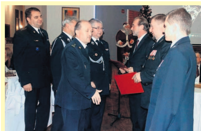
Strażacy z Chełmu odbierają akt powołania do KSRG.

Obecnie na podziale bojowym są dwa samochody: średni MAN (zakupiony ze środków gminnych w 2010 r.) i lekki samochód marki Lublin. ■ Bartłomiej Jarosz