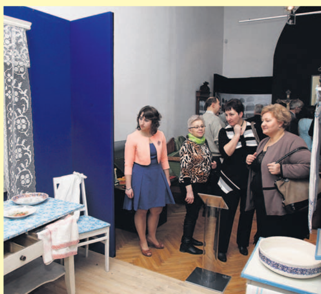
Fragmety ekspozycji i uczestnicy wernisazu.