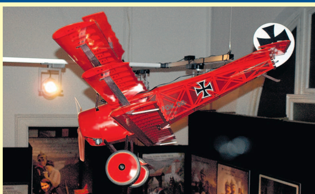
Makieta samolotu wykonana w łędzińskiej modelarni.

Przypomnijmy, że za wieloletnią współpracę w 2013 roku Powiat Bieruńsko-Łędziński został uroczystie zaliczony do Grona Przyjaciół Muzeum Śląskiego ■ MS