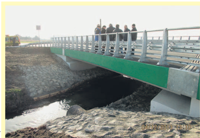
Nowy łędzki most widziany od dołu...