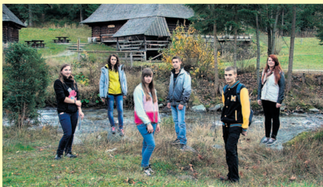
Chwila relaksu i czas na wspólny spacer.