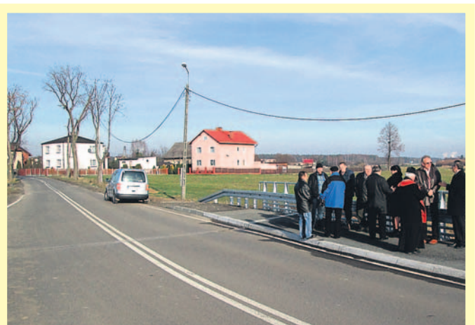
... i od góry – gładka nawierzchnia, czytelne linie, krawężniki.