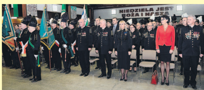
Barbórka w KWK Ziemowit.