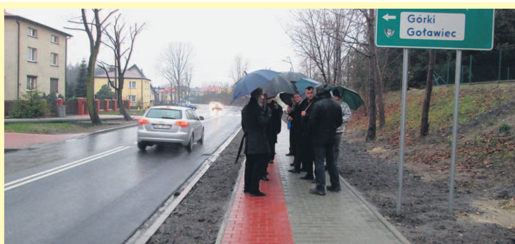
Fragmety ulicy Pokoju w Łędzinach.

■ 9 grudnia nastąpił odbiór dwóch kolejnych ważnych powiatowych inwestycji drogowych w Łędzinach i Imielinie. Chodzi o przebudowę drogi powiatowej 5923S ul. Dzikowej w Łędzinach i Imielinie – etap II (w km od 0+000 do 2+927) oraz o remont drogi powiatowej 5910S ul. Pokoju – etap III (w km od 1+080,00 do 3+341,00). Obydwa zadania były realizowane w ramach usuwania skutków powodzi 2010 roku przy zastosowaniu „cichych asfaltów”.