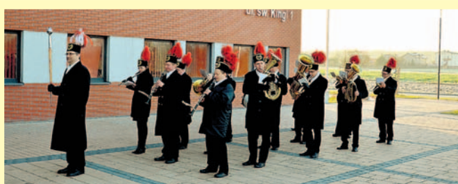
Występ orkiestry dętej KWK Piast przed starostwem.

z górnictwem. Barbórkowa tradycja jest u nas bardzo silna i żywa. Do tradycji tej należą barbórkowa pobudka, przemarsze i koncerty orkiestry dętej. A także spotkania w cechowni, msze święte ku czci patronki i nieodłączne karczmy górnicze z ich wielowiekowymi obzędami. ■ R