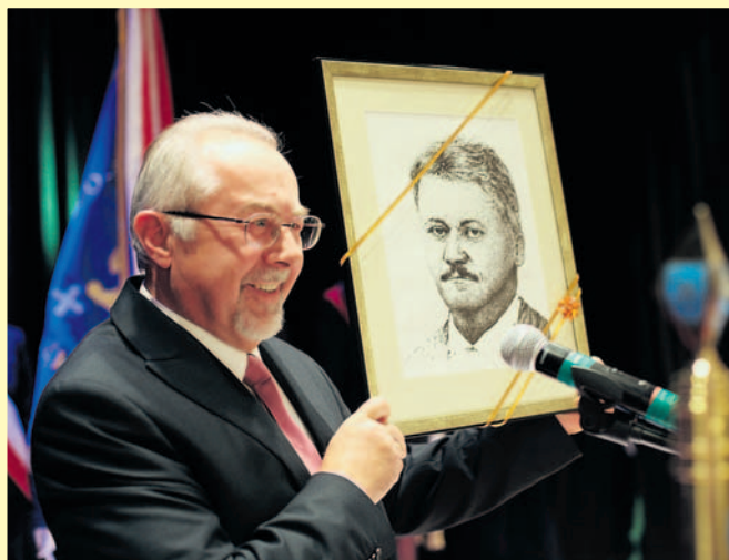
Starosta oświęcimski miał piękne wystąpienie i niecodzienny prezent.

Podczas minionego piętnastolecia w powiecie wykonano szereg cennych i potrzebnych inwestycji materialnych. Pojawiło się wiele ważnych, jednorazowych i cyklicznych imprez i wydarzeń o lokalnym lub nawet ponadlokalnym zasięgu i znaczeniu.