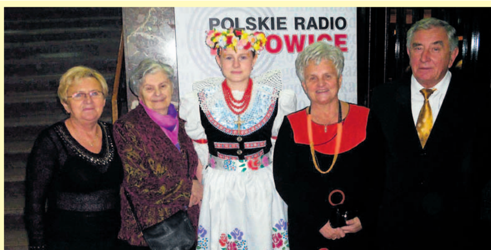
Młodzieżowa Ślązaczka Roku 2013 w gronie seniorów rodziny.

rali się ocalić od zapomnienia pamiątki rodzinne pokazujące jak w poprzednim wieku wyglądał Bieruń i jego mieszkańcy. Tę klimatyczną i pełną wspomnień wystawę można było oglądać w Domu Kultury Jutrzenka w Bieruniu. Organizatorzy nadal zapraszają wszystkich, którzy odnajdą w szufladzie zapomniane zdjęcia przedstawiające Bieruń i jego mie-