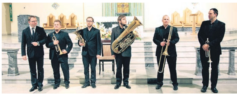
Po koncercie wykonawcy pożegnali się z publicznością.