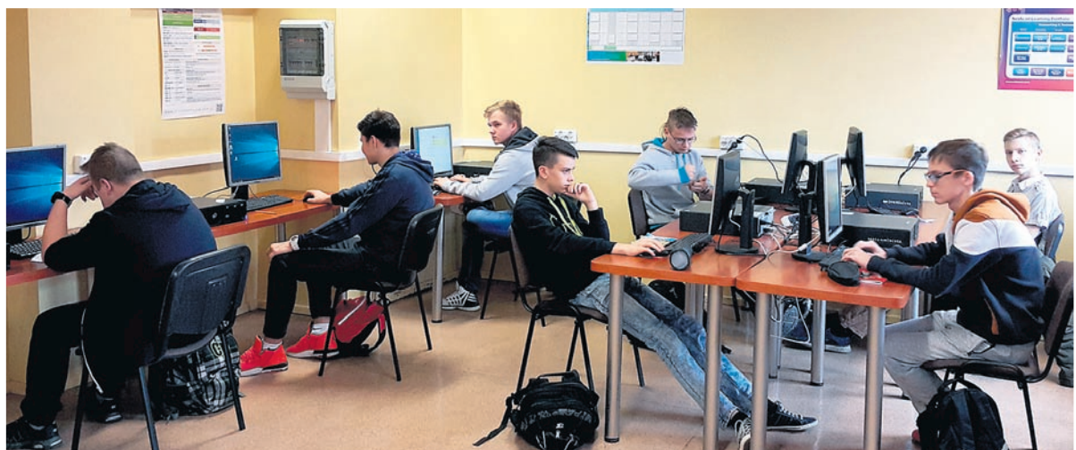
Nowa pracownia komputerowa w PZS w Łędzinach.

Pracownia służy młodzieży przygotowującej się do objęcia w przyszłości posady informatyka. Przeznaczona jest do nauczania przedmiotów informatycznych – przede wszystkim tworzenia baz danych, tworzenia stron www oraz aplikacji internetowych – ale korzystać z niej będą również przyszli elektrycy, którzy za pomocą wyspecjalizowanego