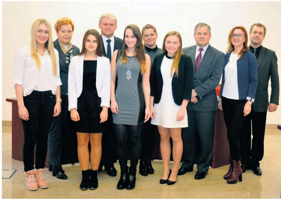
Stypendystki, starostowie i kierownicy powiatowej edukacji.

Zostać stypendystą Prezesa Rady Ministrów nie jest łatwo. Każda szkoła dla młodzieży, któ-