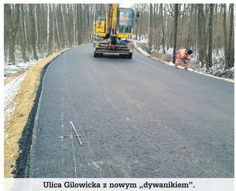
Ulica Gilowicka z nowym „dywanikiem”.

Wartość robót budowlanych wynosi 1 mln 243 tys. zł. Źródłami finansowania tego zadania są środki własne powiatu oraz budżet państwa (Ministerstwa Spraw Wewnętrznych i Administracji). ■