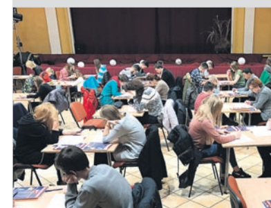
Namysł i skupienie dominowały podczas rozwiązywania testów.

Wielki Test Języka Angielskiego przeprowadzony został 20 listopada w Bieruniu, Tychach, Czechowicach-Dziedzicach, Pszczynie i Bielsku-Białej. Jego uczestnicy rozwiązywali cenione testy TOEIC i TOEFL w odpowiednim dla siebie wariancie: test dla dzieci w wieku 8-12 lat, młodzieży w wieku 13-17 lat oraz dla osób 18+. W bieruńskiej Gamie do testu przystąpiło 55 osób.