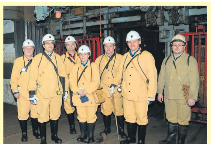
Przed zjazdem na dół KWK "Píast".