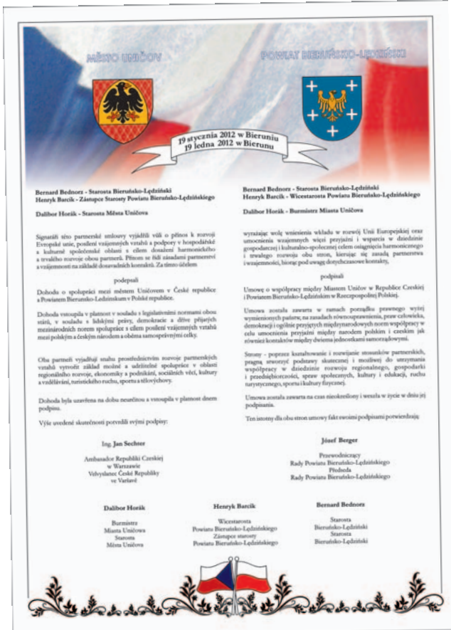
Dokument pamiątkowy towarzyszący podpisaniu umowy.