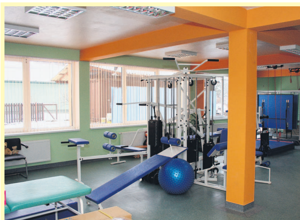
Pomieszczenia ośrodka: dobrze wyposażona sala do zajęć, kolorowy korytarz wymalowany przez artystów - przyjaciół OBK.