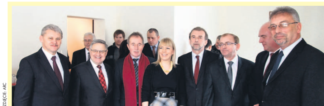
Senator RP, minister rozwoju regionalnego Elżbieta Bieńkowska i goście uczestniczący w oficjalnym otwarciu jej biura senatorskiego w Mysłowicach.

– Tutaj można zgłaszać się właściwie za każdą sprawą. To jest miejsce, które będzie żyć sprawami mieszkańców – zapewniała podczas otwarcia Elżbieta Bieńkowska.