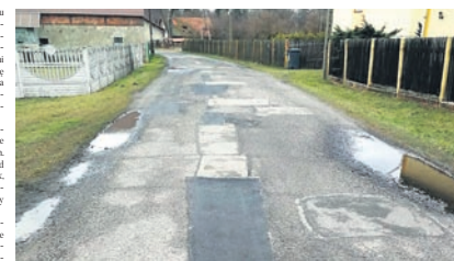
Zamoście – 70 mieszkańców wystąpiło do Zarządu Powiatu o wyremontowanie tej drogi.