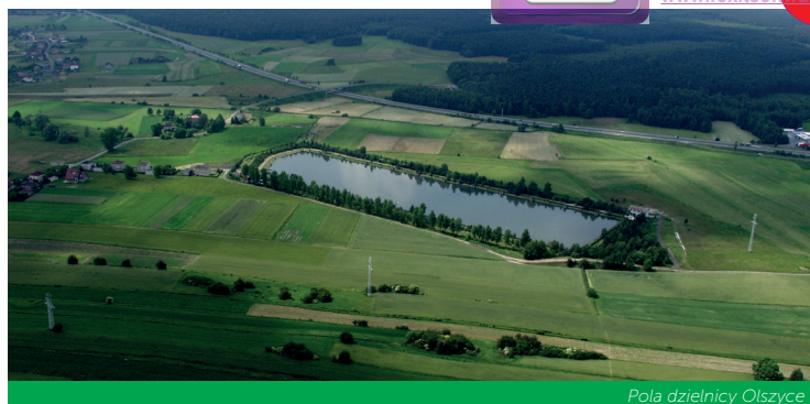
Pola dzielnicy Olszyce

Die Kennzeichnung des grünen Radwegs Nr. 153 endet mit der Straße ul. Zakole, an der Grenze zwischen Łędziny und Wäldern Murckowskie.